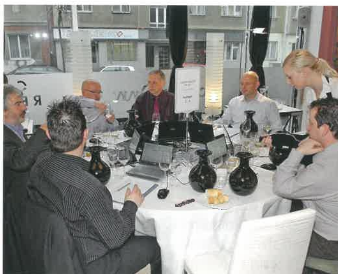
Hodnocení NSV v Praze – rok 2011