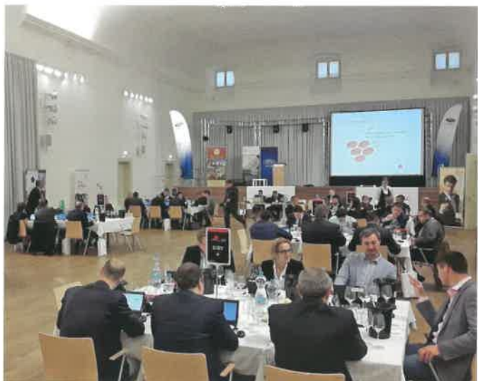
Oenoforum 2016 (zámeek Lednice)

Začínali jsme s cca 20 notebooky, za 10 let jsme obměnili veškerou techniku (WiFi vysílače, server, hodnotící zařízení pro degustátory – nyní používáme tablety) a také vlastní program neustále doplňujeme a vylepšujeme. ■