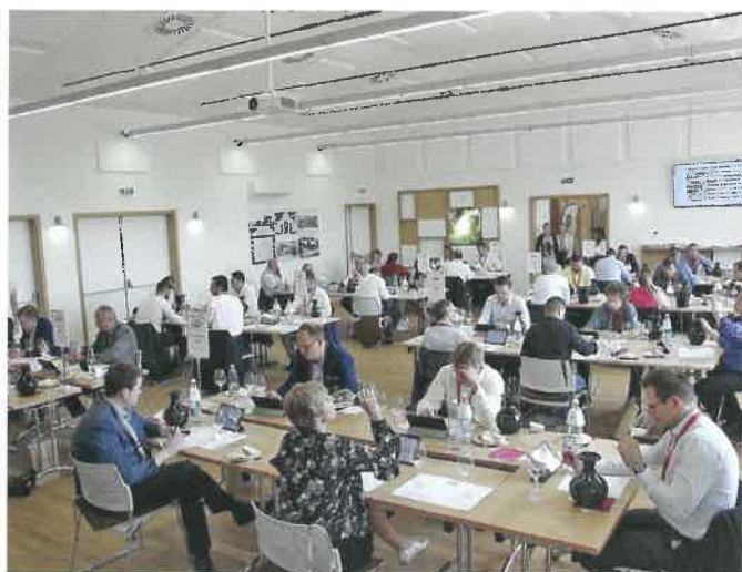
Hodnocení v nově rekonstruovaném sále Centra Excelence ve Valticích. Zde již na nových tabletech Samsung (2018)