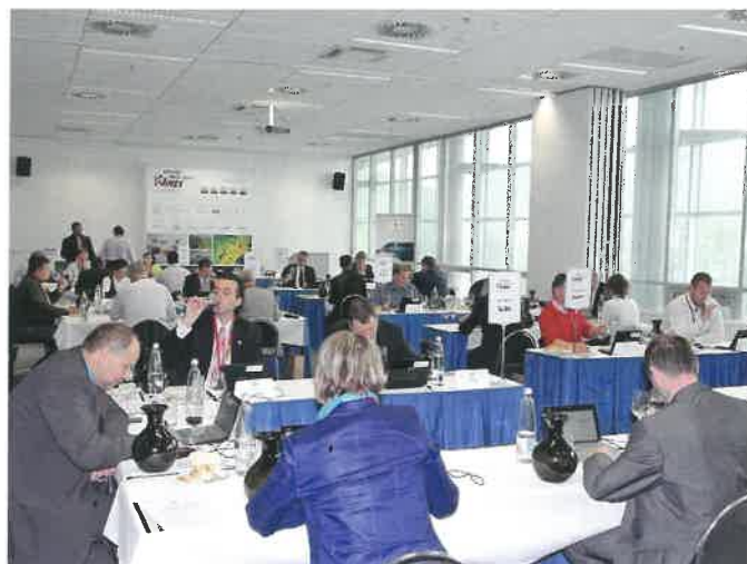
Hodnocení Grand Prix Vinex 2013 na brněnském výstavišti

Pro hodnocení používáme vlastní server a WiFi síť, takže nejsme závislí na vnějším připojení k internetu a stabilitě celého systému, což je velká výhoda. Hodnotící část umí pracovat také v on-line verzi, kdy si organizátor zajistí vlastní tablety či notebooky pro hodnotitele a připojuje se pro hodnocení přes internet na klasický webový server.