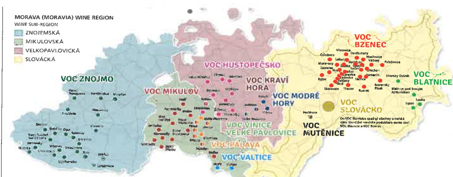
Obr. 1: Mapa VOC

Dalším problémem je malý zájem vinařů o toto zatřídování (až na výjimky) – tj. vína zatříděná jako VOC tvoří pouze cca 0,7 % z objemu vín s CHOP v ČR! Za další nezbytnou podmínku pro